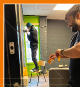
Jongeren centrum Flex C, Hoofddorp