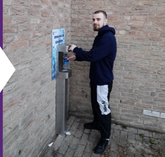
Lissersbroek - De Meerkoet & De Nooduitgang