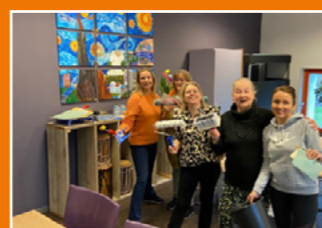
Wijkcentrum Linqenda, Nieuw-Vennep