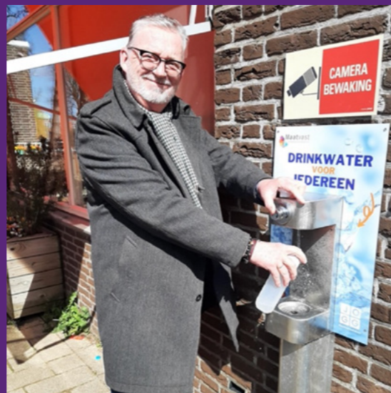
Hoofddorp - De Nieuw Silo & J.C. De Silo