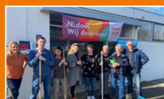
Dorpshuis Marijke, Burgerveen