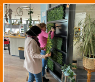
Wijkgebouw De Amazone, Hoofddorp