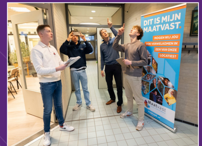
Studenten aan het scannen in De Amazone